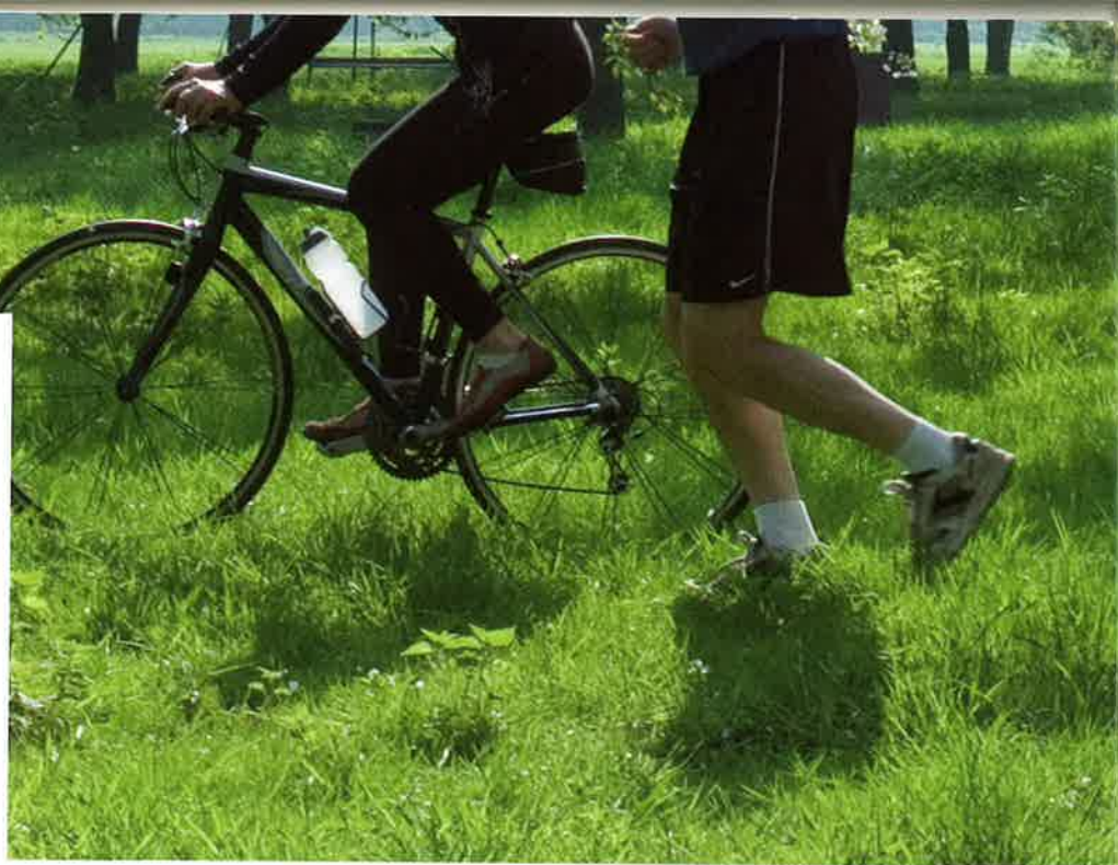
Sociaal actief blijven is goed voor de mentale en fysieke gezondheid...

50plusnet: een website voor vijftigplussers.